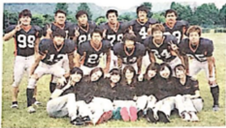
4年生の部員と写る筆者(前列左から4人目)