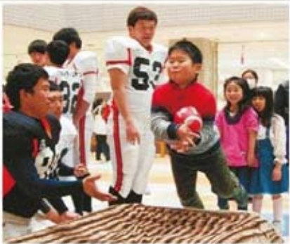
部員の手ほどきを受けながらボールをダイビングキャッチする子ども＝岐阜市正木中のマーサ21で

小学生や幼児にアメ リカンフットボールに 親んでもらう体験イ ベントが二十五日、岐 阜市正木中の大型商業 施設「マーサ21」であ り、多くの親子連れが 楽しんだ。 岐阜大アメリカカンフ ットボール部が企画。 冒頭、ユニホーム姿の