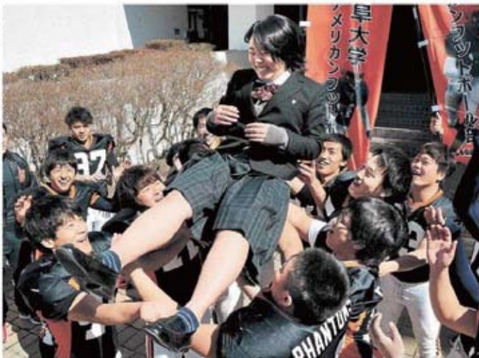
合格を果たし、アメリカンフットボール部に胴上げで祝福される受験生＝6日午後0時19分、岐阜市柳戸、岐阜大